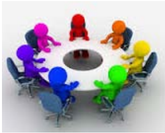
L'Association des implantés cochléaires du Québec

De nombreux professionnels sont amenés à intervenir auprès de vous et de vos enfants!